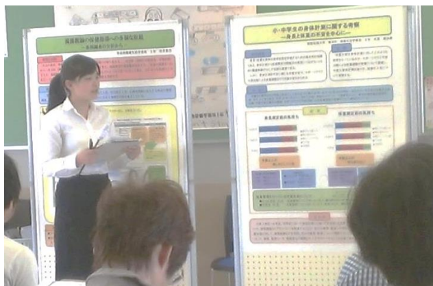
ポスターは見やすさ重視。グラフ配置も試行錯誤