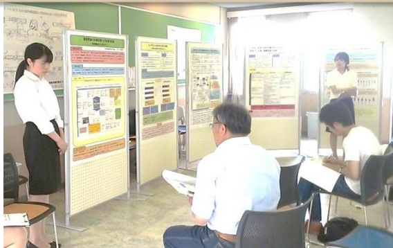
中学校の先生から、歯科指導に関する質問