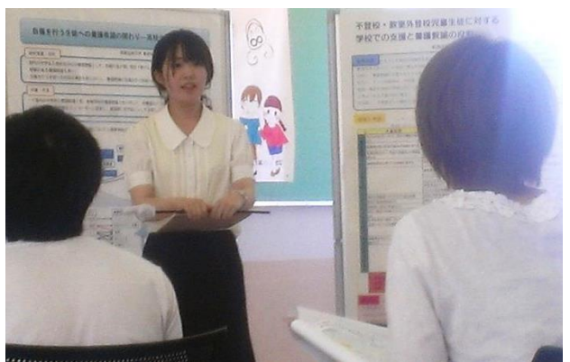
活発な質疑応答であつという間の1時間でした