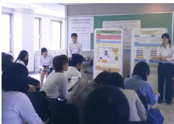
オープンキャンパス参加高校生も少々見学