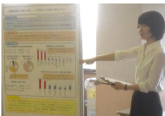
今度は学会発表を目指します!との感想も

発表テーマ「養護教諭の保健指導への多様な取り組み」「小・中学生の身体計測に関する考察」「自傷行為のある生徒と養護教諭の関わり」「不登校・教室外登校児童生徒に対する学校での支援と養護教諭の役割」「養護教諭不在時の対応」